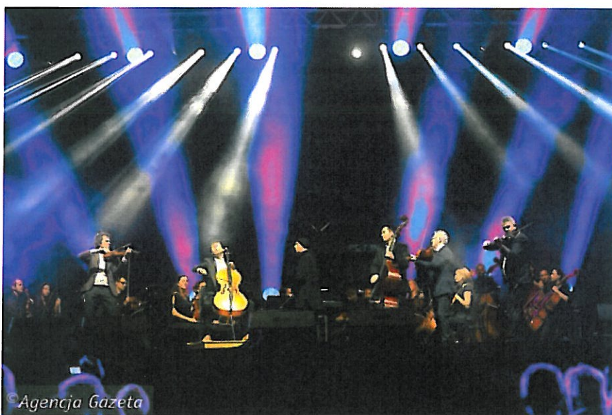
Zespół Wołosi zagra 18 września na inauguracji nowego sezonu Filharmonii Częstochowskiej (DAWID CHALIMONIUK)